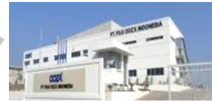
PT. FUJI OOZX INDONESIA(FOI) Indonesia (West Java)

Technical Assistance Contract (~2019 12. E)