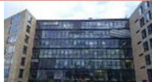
FUJI OOZX EUROPE(FOE) Germany (Stuttgart)