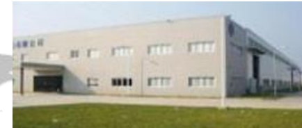
FUJI VALVE GUANGDONG(FVG) China (Guangzhou)

Production capacity (17) : 26 Mil..pcs/Y