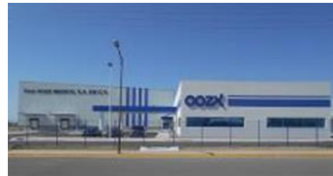
FUJI OOZX MEXICO(FOM) Mexico (Guanajuato)

Production capacity (17) : 11 Mil. Pcs/Y