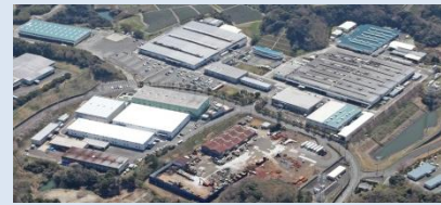
静岡本社 フジ和-バルブ