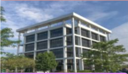
FUJI OOZX AMERICA (FOA) U.S.A. (Chicago)