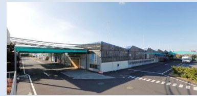
藤沢工場 (オーゼックステクノ)